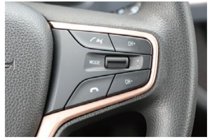
マルチオーディオ