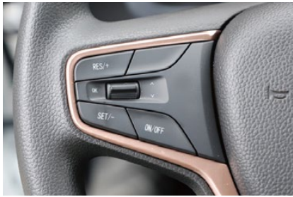
クルーズコントロール