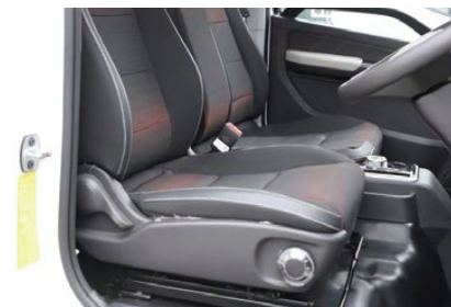
サスペンションシート