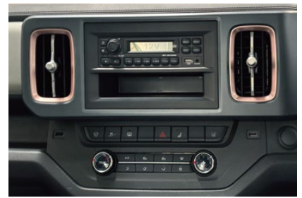
ラジオ & 空調