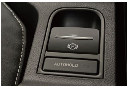
電動パーキングブレーキ