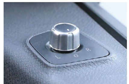
ミラー調整ダイヤル

※画像はイメージです。実際の商品とはデザイン・仕様が一部異なる場合がございます。