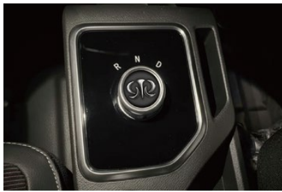
シフトセレクター